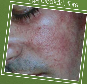
Ytliga blodkärl, före